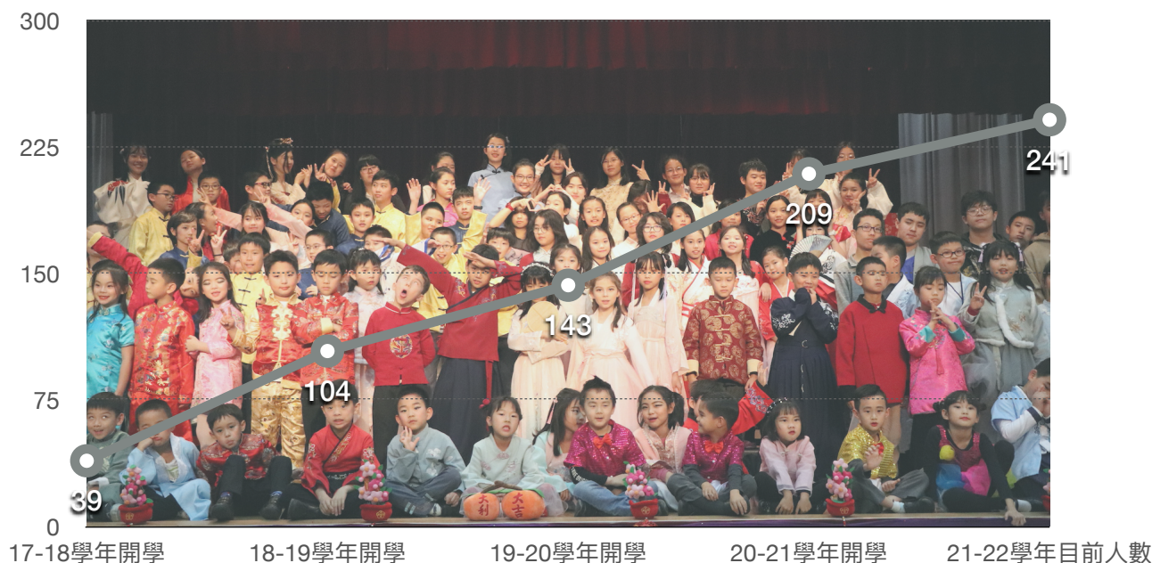
學生人數變化統計