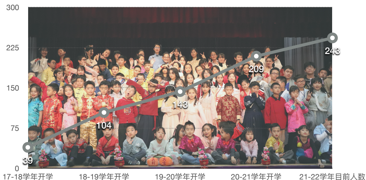
学生人数变化统计