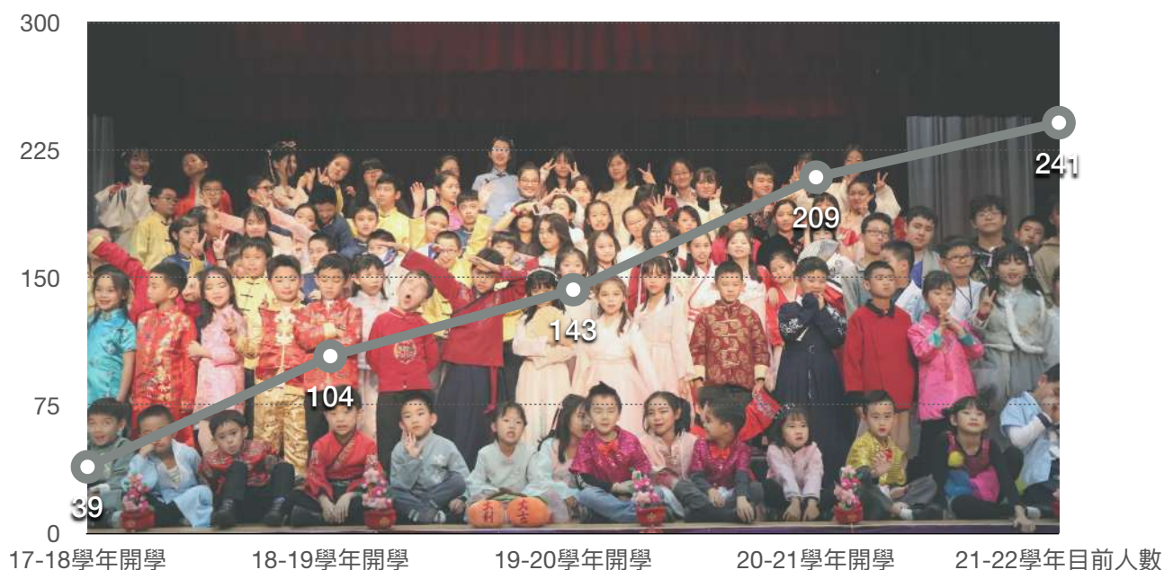
學生人數變化統計