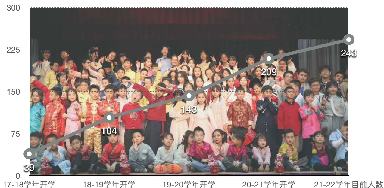
学生人数变化统计